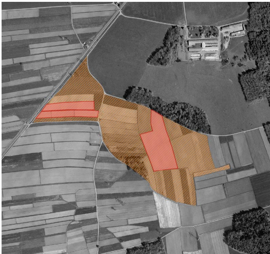
Karta 2.1: Grafični prikaz razmejenih območj rumenih krompirjevih ogorčic v K.O. Žabnica (rdeče: žarišče, rjavo: varnostno območje)